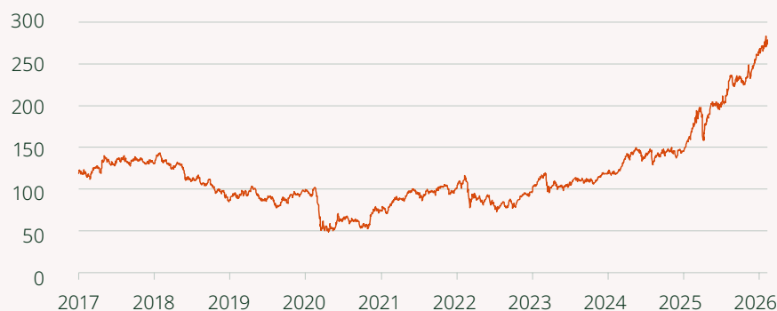
Graf a výkonnosť aktualizované k 11.02.2026