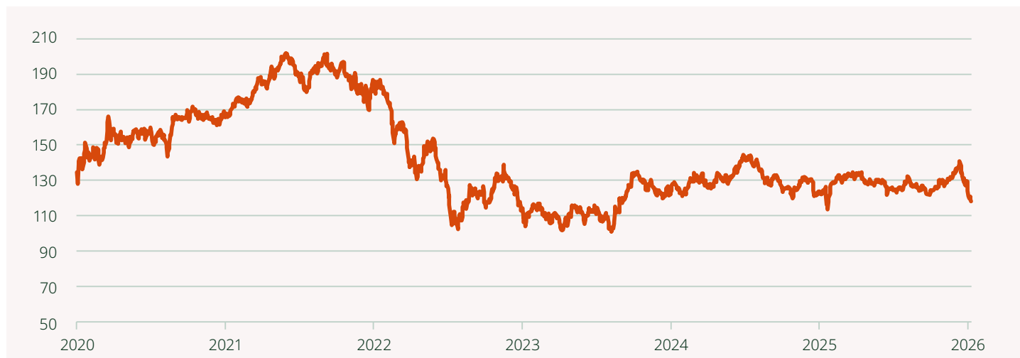
Graf a výkonnosť aktualizované k 27. 3. 2026

Zdroj: Webová stránka STOXX, údaje aktualizované k 27. 2. 2026